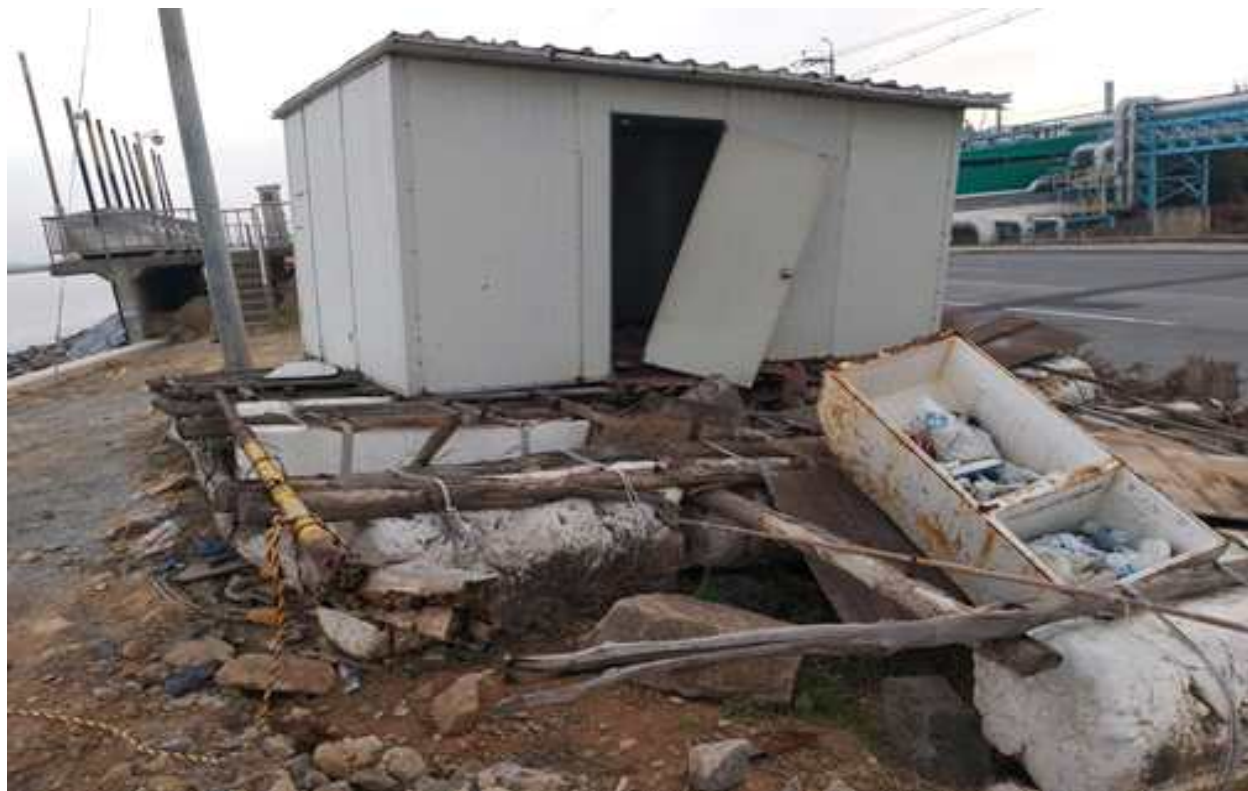
전라북도 군산시 소룡동 221